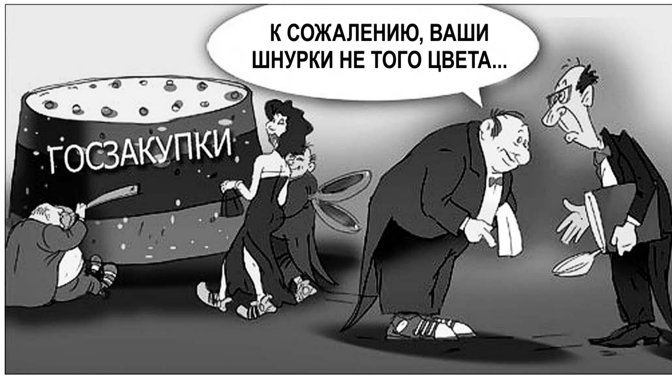
Федеральная контрактная система делает прозрачнее процесс расходования бюджетных денег. Теперь заказчик должен обосновать необходимость закупки