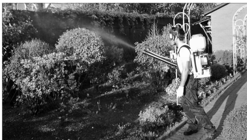
Июнь - это месяц непрерывных «разборок» с вредителями

В июне можно подкармливать, не опасаясь, что внесем избыток азота: он весь успеет переработаться при бурном построении зеленой массы и не приведет ни к накоплению нитратов в плодах, ни к их по-