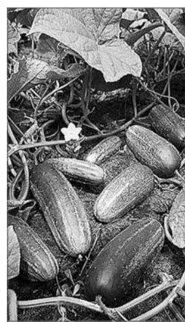
Полосу подготовила Любовь ПАВЛОВА

Все такие кривые огурцы надо сразу снимать и использовать в салатах. На вкусовые качества форма плода не повлияет.