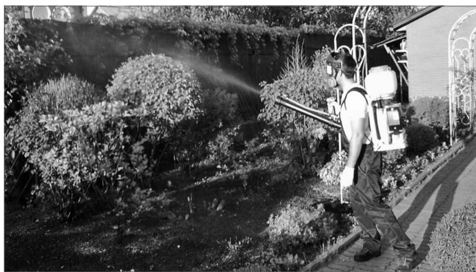
Июнь - это месяц непрерывных «разборок» с вредителями

Во-вторых, в самом растении происходит перераспределение элементов питания: и азот, и фосфор, и калий перетекают из тканей,