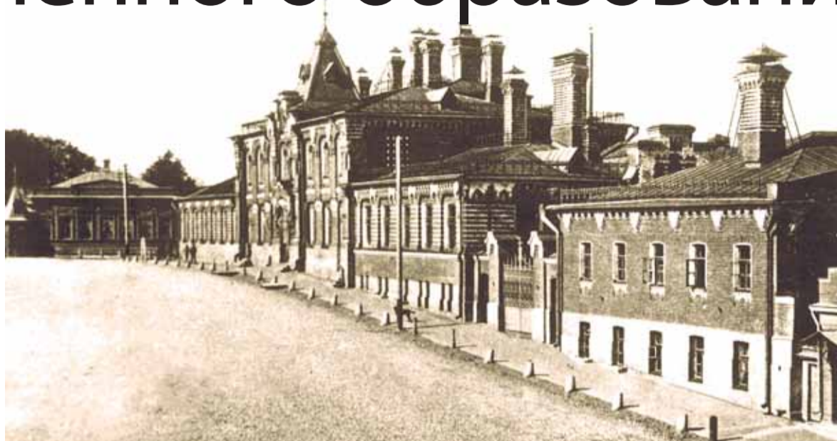
Мальцовское ремесленное училище

Согласно § 1 устава, училище было открыто «с целью дать возможность детям беднейших родителей бесплатно получить правильное и рациональное обучение полезнейшим ремеслам и необходимым для хорошего ремесленника образовательным и техническим наукам». В него принимались мальчики всех сословий и вероисповеданий от 13 до 15 лет, здорового телосложения и хорошего физического развития, не имевших каких-либо недостатков, которые могли бы помешать их ремесленным занятиям. Учащиеся получали бесплатно от училища все нужные для учебных занятий ин-